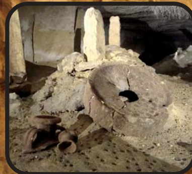
Cimetière et vestiges gallo-romains. Gallo-Roman cemetery and ruins.