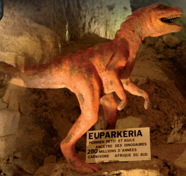
EUPARKERIA PERMIEN PETIT ET AGILE ANCESTRE DES DINOSAURES 280 MILLIONS D'ANNEES CARNIVORE AFRIQUE DU SUD