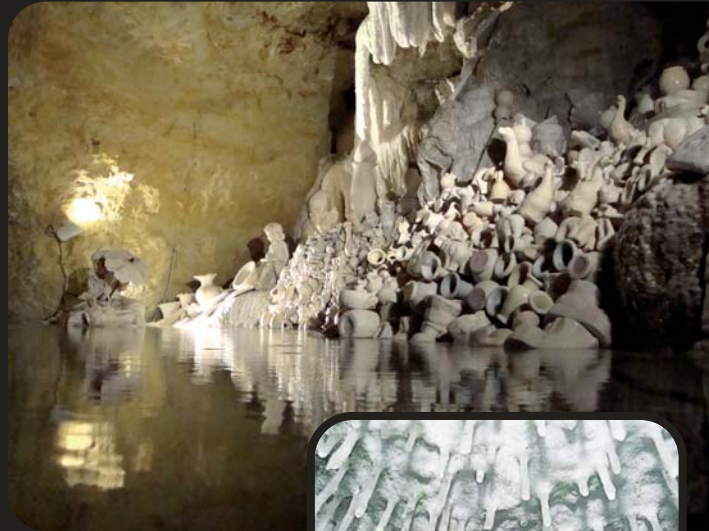
Stalactites fistuleuses. Tube-like stalactites.

Petrified waterfall with rimstone pools and draperies.